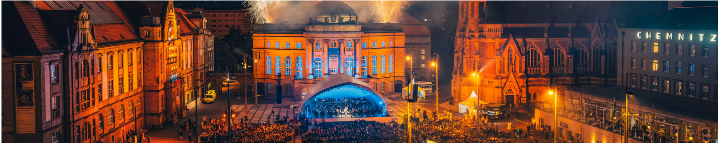
Chemnitz Theaterplatz