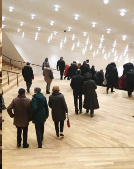
(o.l.) Elbphilharmonie © Thies Raetzke; (o.) Großer Saal und Foyer ©ViadellArte/Poppen, Text Bild unten: Landungsbrücken ©ViadellArte/Poppen; (u.l.) ©ViadellArte/Poppen; Bild im Text unten rechts: Hansestadt Buxtehude

im Herzen Hamburgs lässt seine Gäste hinter die Kulissen schauen: Wer waren die musikalischen Akteure? Wie lebten sie? Unter welchen Bedingungen arbeiteten sie? Wie entstanden ihre Kompositionen? Wie klingt ihre Musik? Im KomponistenQuartier lässt sich die Musikstadt Hamburg ganz neu entdecken!