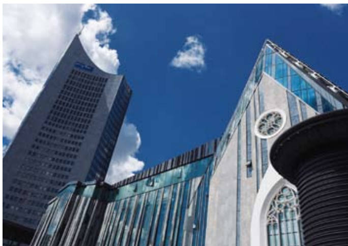
MDR-Gebäude und Paulinum