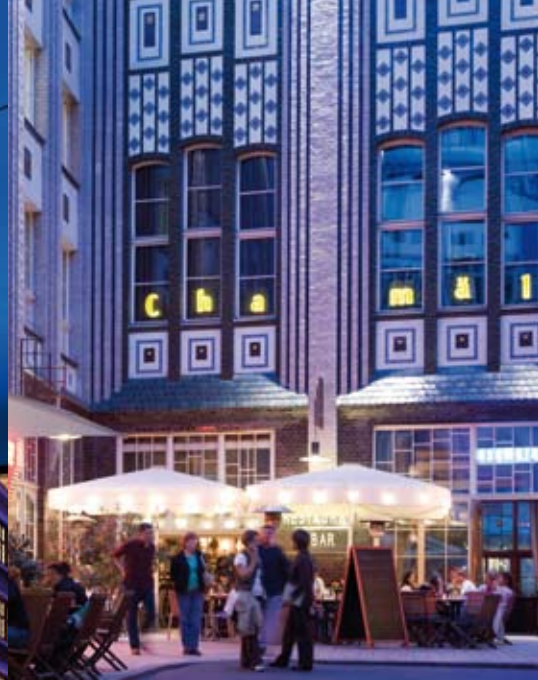
(l.) Brandenburger Tor Foto: Wolfgang Scholvien, (r.) Hotel Ellington, Foto: Amin Akhtar; Hackesche Höfe © Visit Berlin/Pierre Adenis

werden Sie im Ballhaus Berlin erwartet, traditionell ausgestattet mit Tischtelefon.