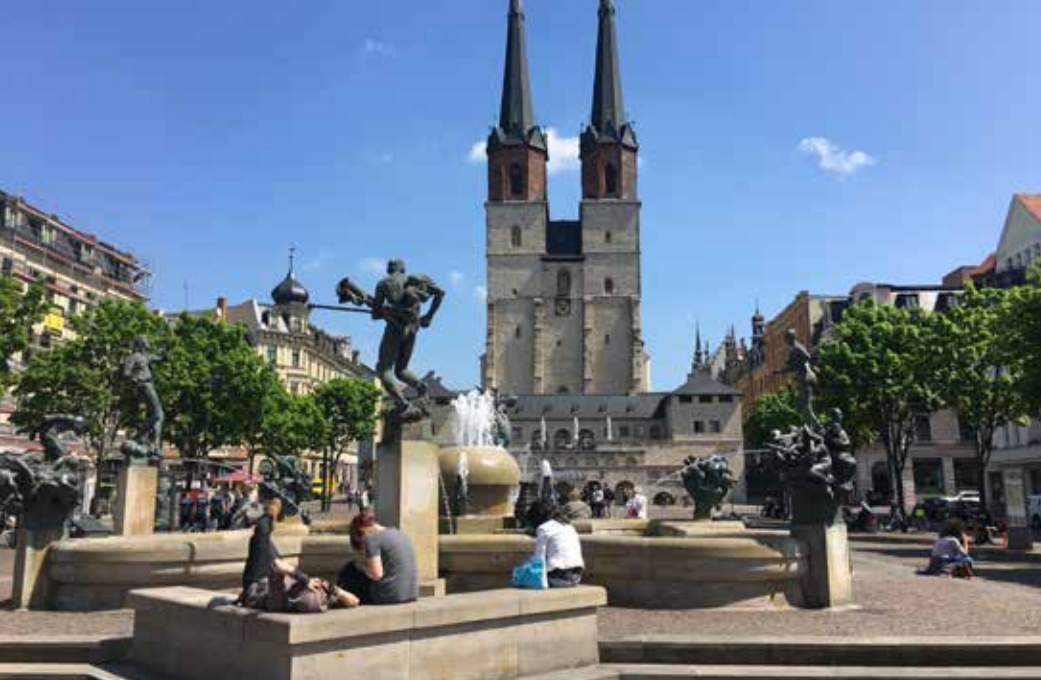
(o.l.) Ringheiligtum Pömmelte; (u.l.) Himmelsscheibe; (o.) Halle und Arche Nebra Besucherzentrum