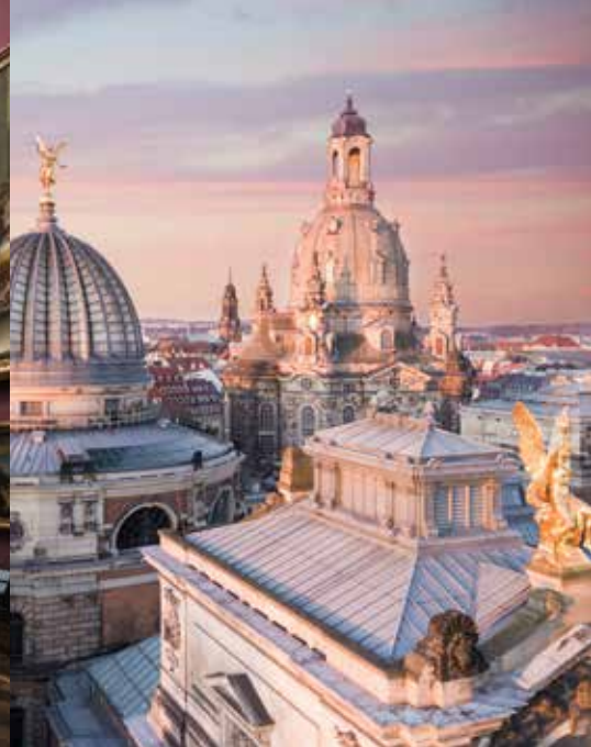
(o.l.) ©Tourismusverband Sächsische Schweiz, Rico Richter; (o.r. / Bild im Text) Dresden Marketing GmbH, Mediaserver Dresden; (u.l.) Caspar David Friedrich (1774–1840), Wanderer über dem Nebelmeer, um 1817, Dauerleihgabe der Stiftung Hamburger Kunstsammlungen © SHK / Hamburger Kunsthalle / bpk, Foto: Elke Walford

damals nur in kleinen Gruppen und, so der Wunsch des Königs, „mit sauberer Kleidung“. Unser Besuch findet ohne Führung statt, weil es die Räumlichkeiten nicht zulassen. Vergoldete Gefäße aus Edelsteinen und kostbare Naturalien wie Straußeneier und Bergkristalle, der Nautiluspokal sowie das Juwelenzimmer zeugen vom Reichtum August des Starken. Auch im Neuen Grünen Gewölbe sind faszinierende Schätze ausgestellt wie der Kirschker, in den 185 Köpfe geschnitzt sind, und der größte grüne Diamant, der