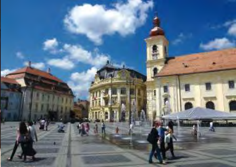
(o.v.l.n.r.) Schloss Peles ©Pixabay; Sighisoara ©Pixabay; Sibiu ©Marius Mitea; (u.l.) Schäßburg ©Pixabay; Bild im Text: Sibiu ©Pixabay

rer außergewöhnlichen Bedeutung zum UNESCO-Weltkulturerbe. Am Nachmittag fahren wir nach Sibiel/Budenbach und besichtigen das Hinterglasikonen-Museum. Lassen Sie sich von der ländlichen Atmosphäre einfangen und genießen Sie ein Abendessen bei Gebirgsbauern.