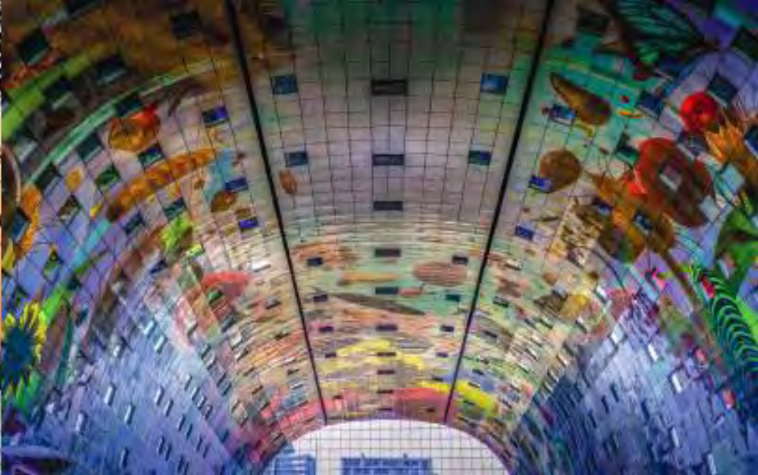
(o.v.l.n.r.) Neues Depot ©ViadellArte/ Gogolin; Rotterdam Skyline ©ViadellArte/ Gogolin; Neue Markthalle ©Pixabay; (u.l.) Hauptbahnhof ©Pixabay; Bild im Text: Cube Houses ©Pixabay

stilhotel „New York“ ein, einst das Hauptquartier der Holland-Amerika-Linie. Das „Manhattan an der Maas“ will auch von Ihnen entdeckt werden!