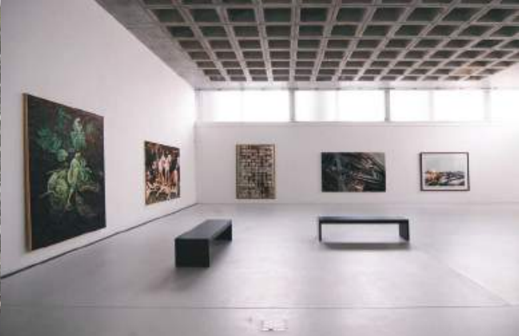
(o.v.l.n.r.) KAB Depot innen, Ziehgitter ©Martin Maleschka; MdbK Haupteingang ©Punctumm/ A. Schmidt; BLMK Dieselmotorkraftwerk Innenansicht ©Marlies Kross; (u.l.) Dieselmotorkraftwerk ©Marlies Kross

Packhof ist ein Standort des Brandenburgischen Landesmuseums für Moderne Kunst, das über 30.000 Arbeiten aus der Zeit der DDR zu seiner Sammlung zählt. Hier studieren Sie die enorme Vielfältigkeit der Stile und Arbeiten unterschiedlicher Schulen – wie wir sie auch aus westlichen Kunstzentren kennen.